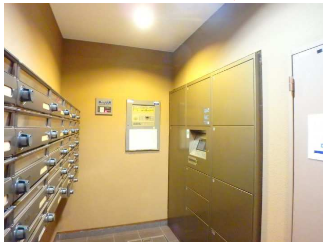
エントランス・メールボックス